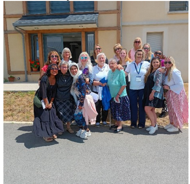
visite des élèves infirmières américaines Bon Secours