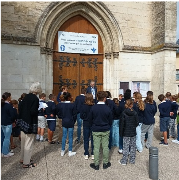
Rentrée des élèves de 6 ème