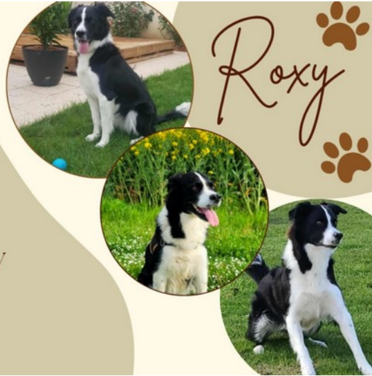
C'est la rentrée pour Roxy, et Rouky

À partir du mois de septembre vous pourrez croiser Roxy au sein du Bon Secours.