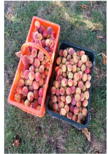
Don de fruits