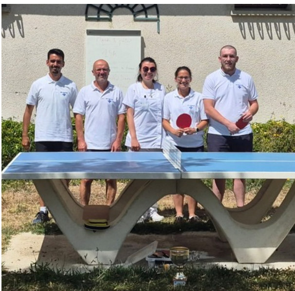
Tournoi de ping pong